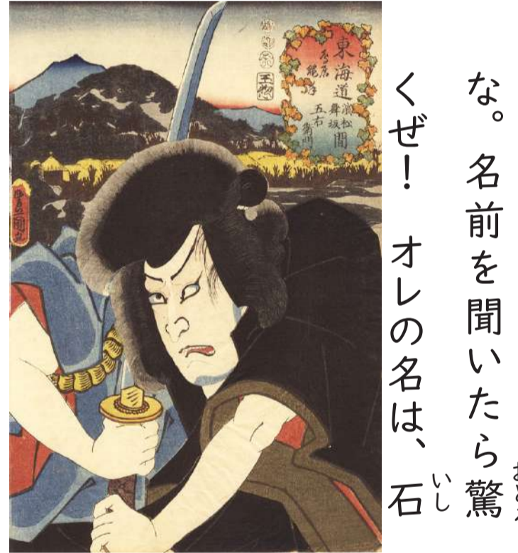
うたがわくにさだ さんだいとよくに どうかいどうはまつまいさかかん とりい なわて ご えもん 歌川国貞(三代豊国)「東海道浜松舞坂間 鳥居繩手 五右衛門」